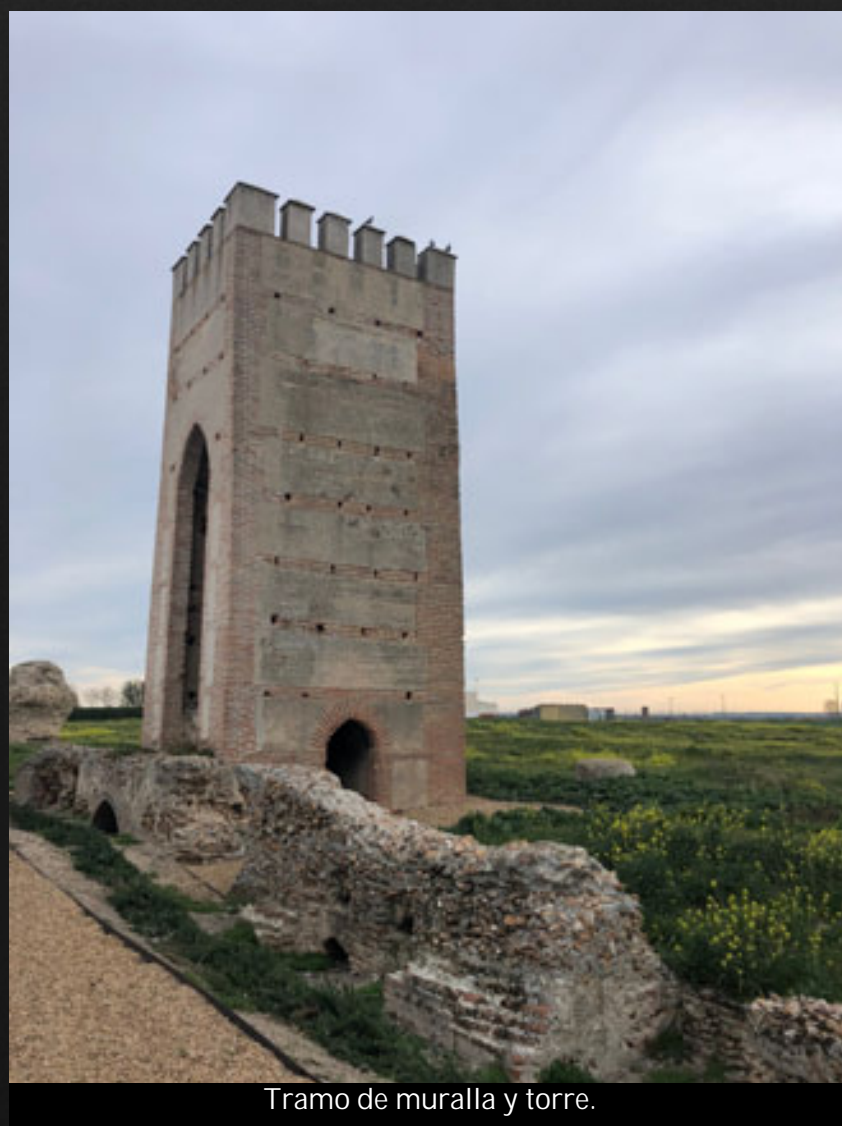
Tramo de muralla y torre.

Las murallas de Madrigal tienen un perímetro curvilíneo, que ha sido tenido por circular en algunas épocas, tal como se representa en la cartografía de Francisco Coello a mediados del siglo XIX (1864).