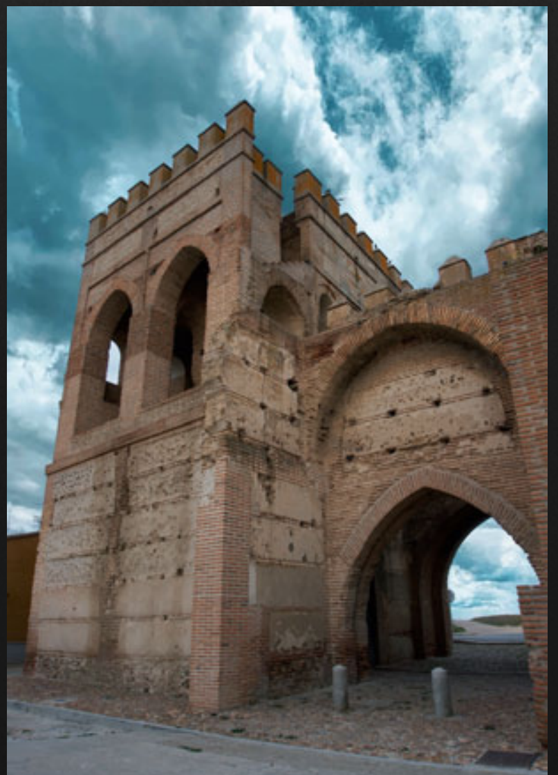
Puerta de Cantalapiedra.

Es visita obligada el Real Monasterio de Nuestra Señora de Gracia, antiguo palacio agustino donde nació la reina Isabel de Castilla, así como la Iglesia de San Nicolás, con