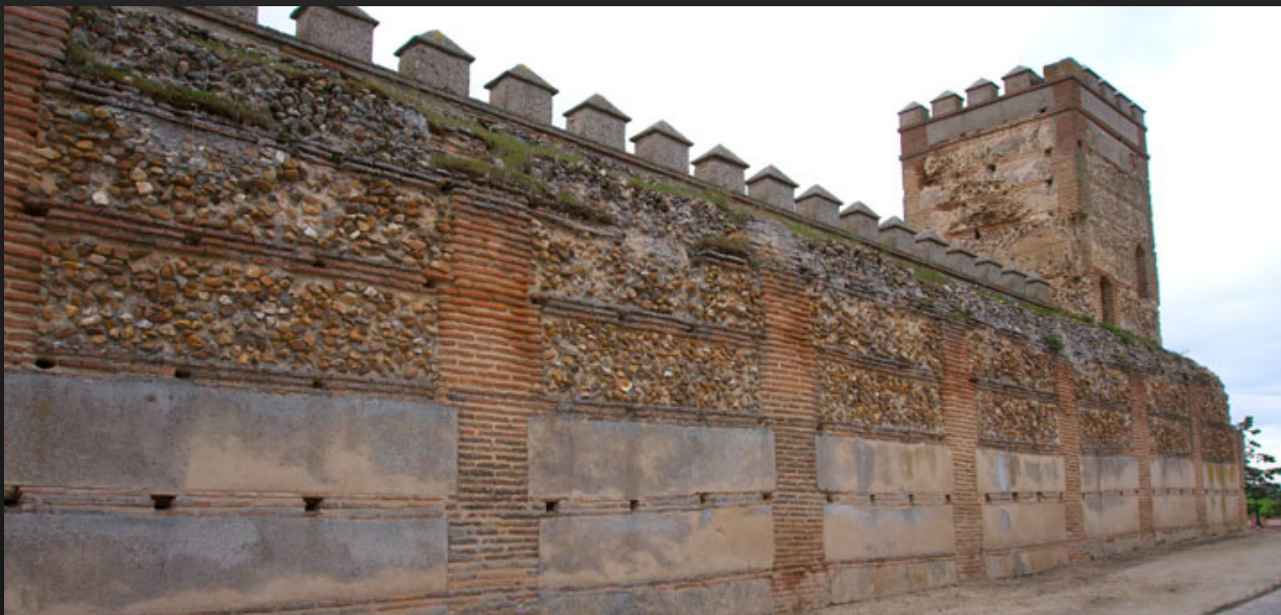
Detalle de la muralla donde se aprecia su material básico: tapial de tierra apisonada y piedra de río encintado de ladrillo.

El aparejo sigue el modelo Toledano de mampostería y ladrillo, aunque aquí la mampostería se sustituyó por tapial con machones y verdugadas de ladrillo que encuadran los tapias de argamasa revocados en los entrepaños.