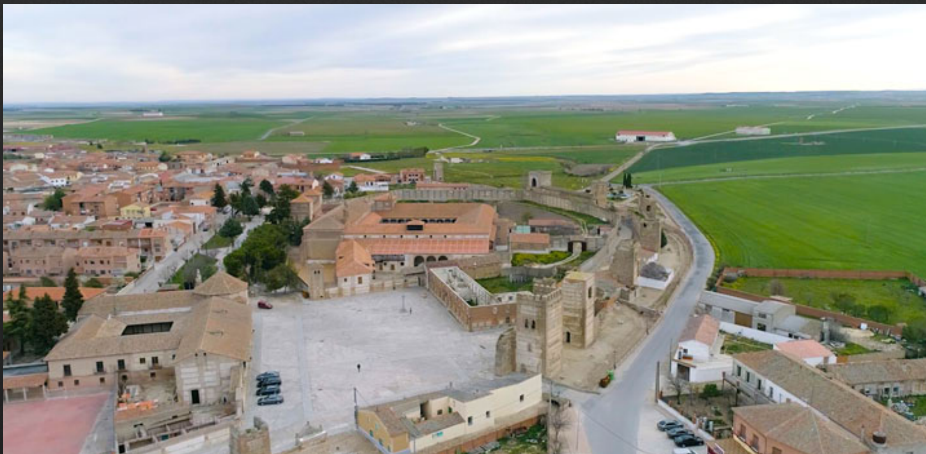
Vista de Madrigal de las Altas Torres desde de la Puerta de Peñaranda.