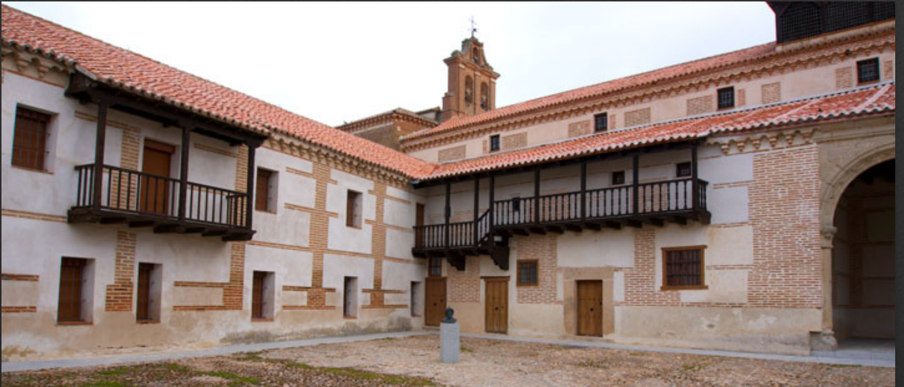
Convento MM. Agustinas. Casa Natal Isabel La Católica (s.XV).