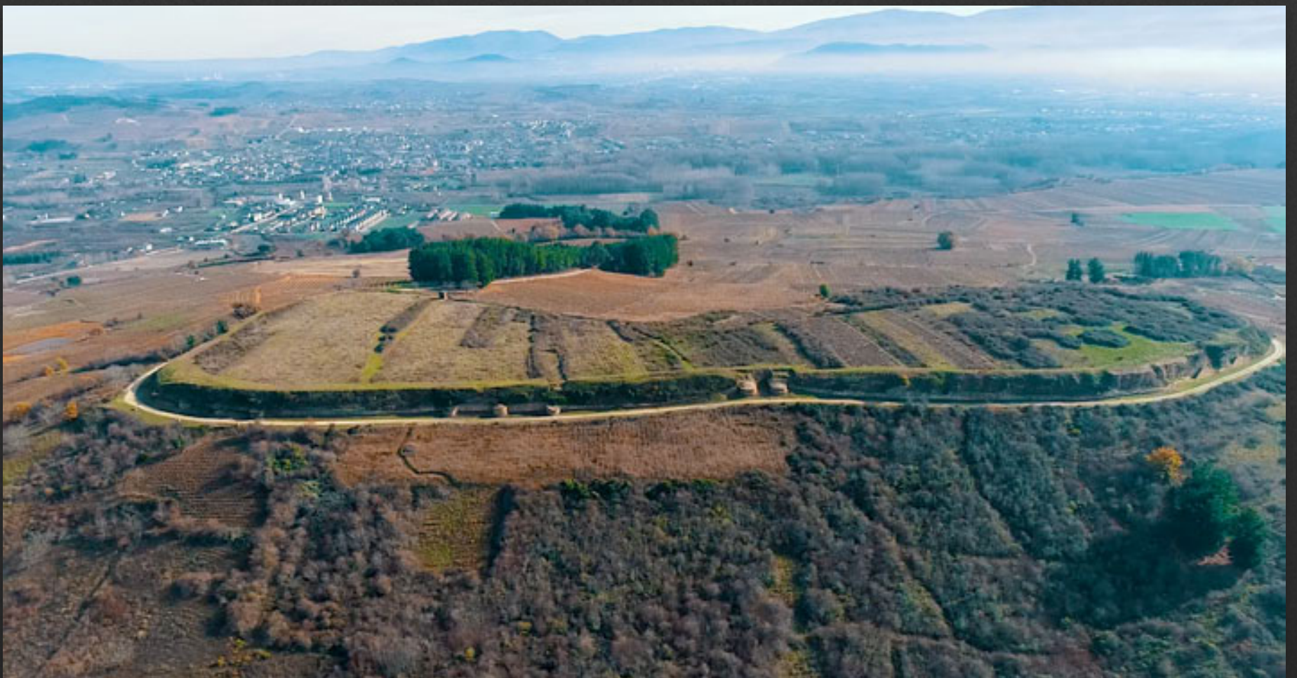
Vista aérea desde la que se puede apreciar el tamaño del asentamiento rodeado de su muralla y sus cubos.

ro por la intromisión de los monasterios y villas cercanas, el rey renuncia a la repoblación.