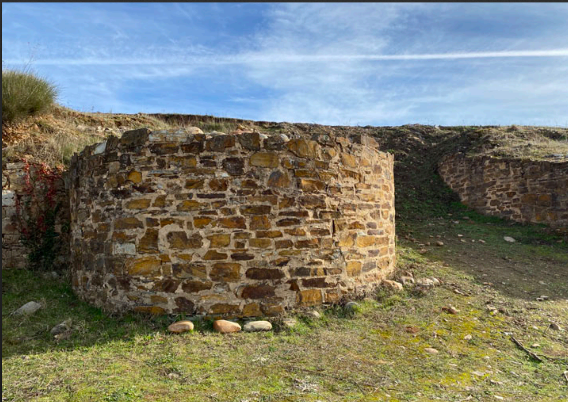
Cubos de la muralla del Castro de la Ventosa.

Los celtas la llamaban Bergdunum, literalmente «Ciudad fortificada en lo Alto». Se entiende perfectamente pues desde lo alto de sus murallas es posible dominar todos los alrededores, constituía el centro del poder de la comarca.