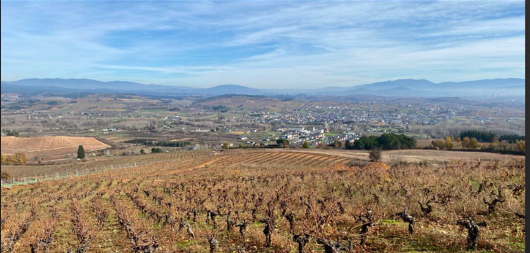
Maravillosas vistas desde lo alto del castro.

La ruta es muy corta y apta para todos los públicos si se sube hasta el aparcamiento a pie del castro. También se puede subir andando desde el desvío que encontraremos nada más entrar a Pieros, pasado Cacabelos. Una señalización nos indicará el desvío No es la única forma de acceder, se puede subir desde Valtuille o desde Villadecanes a través de viñedos.